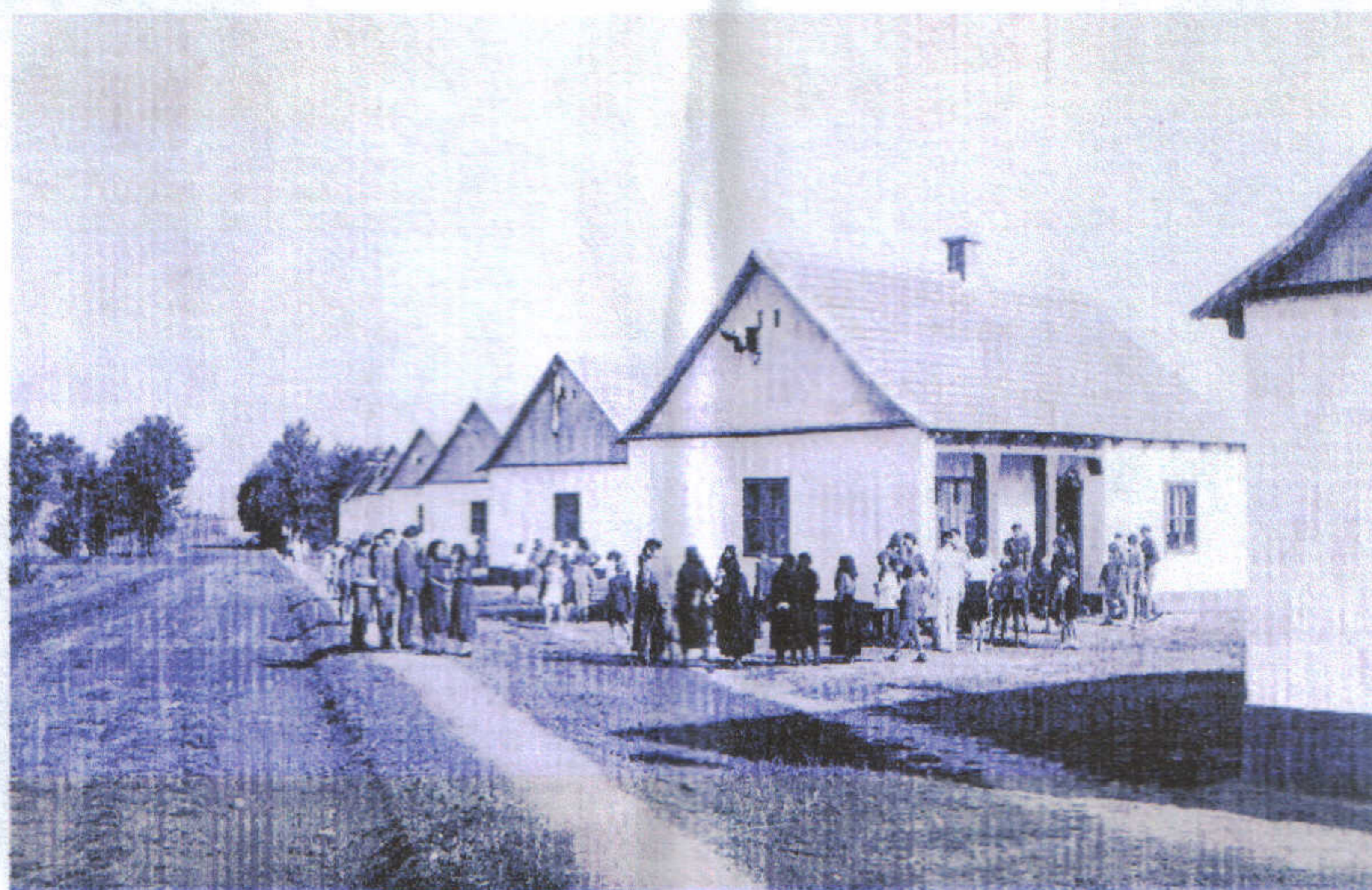
ONCSA HÁZAK AVATÁSA - Molnár Lajos főjegyző idején