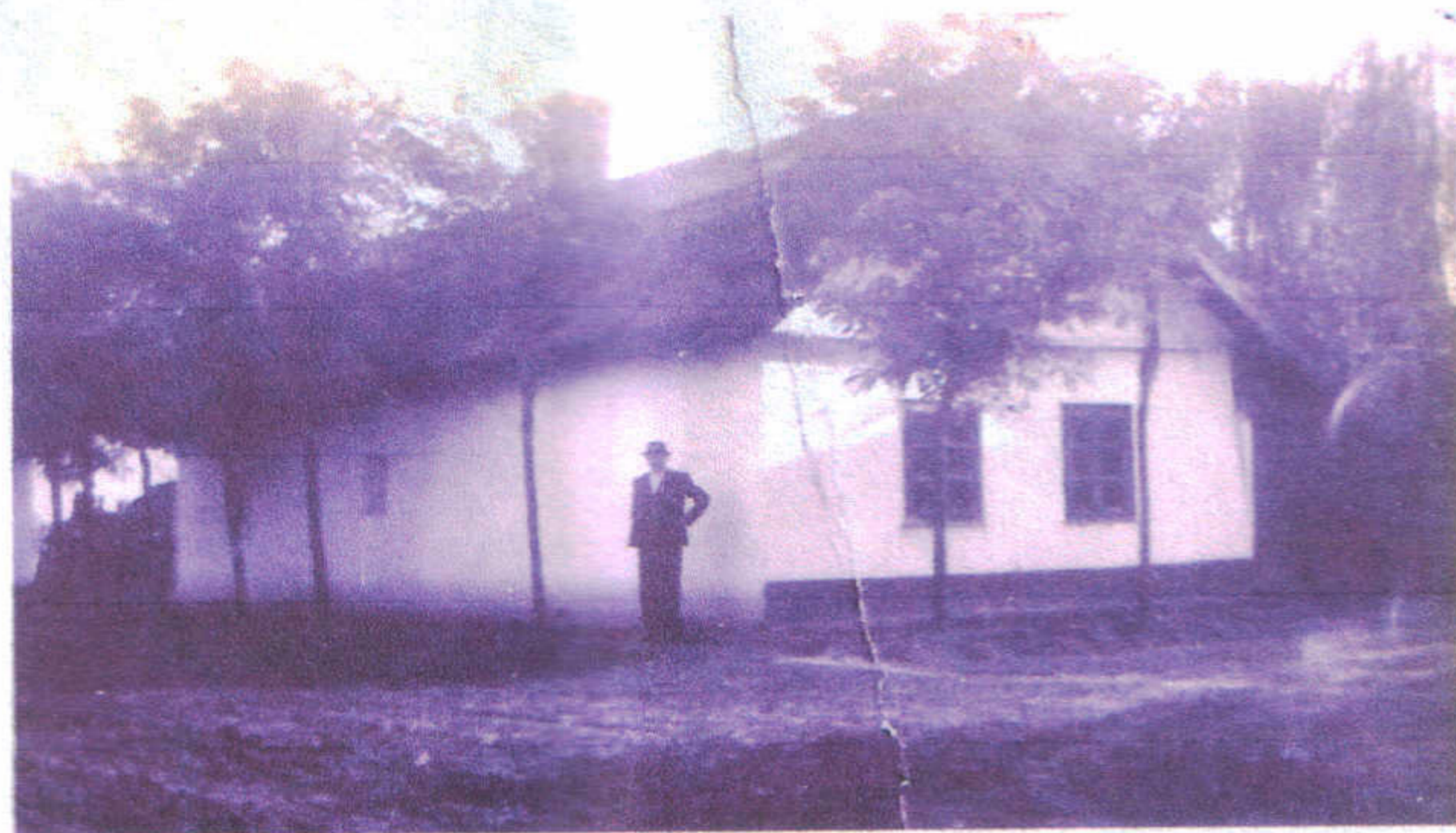
3. sz. melléklet