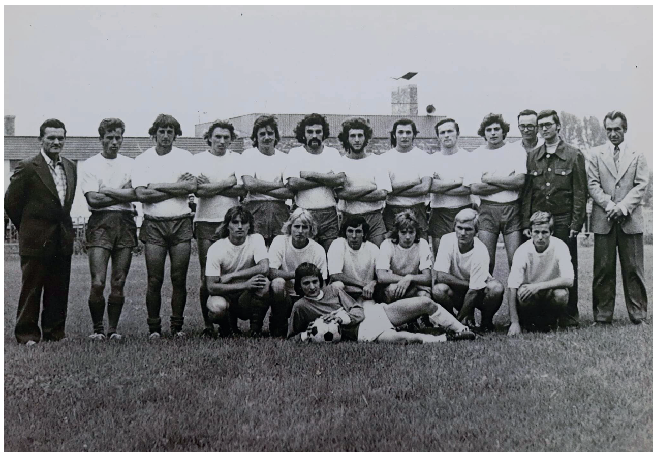
fotón a feljutó csapat kerete