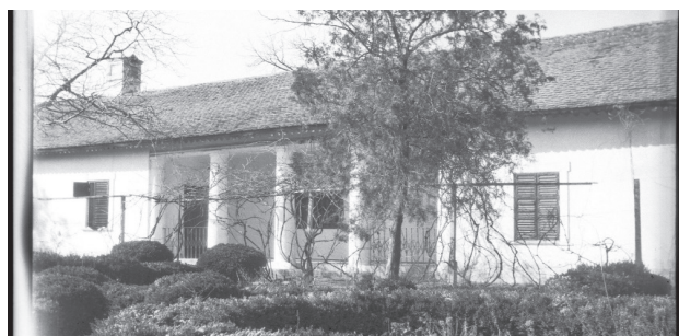
Fényképfelvétel az 1940-es évek elejéről

Hamarosan készül az épület és a család története. Addig is ízelítő az udvarházzal!