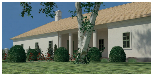
Szőke Balázs grafikája