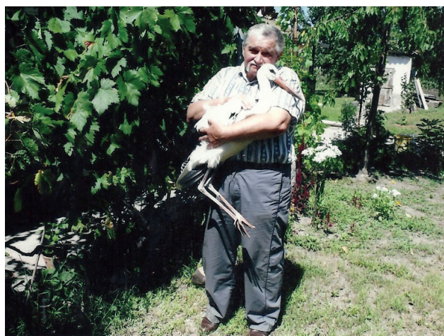
sikeres fehér gólya mentés

Kiragadnék pár pillanatot egy madárkutató sokszínű életéből innen-onnan, a teljesség igénye nélkül: Jó pár madár életét mentette meg, melyeket képekkel dokumentált.