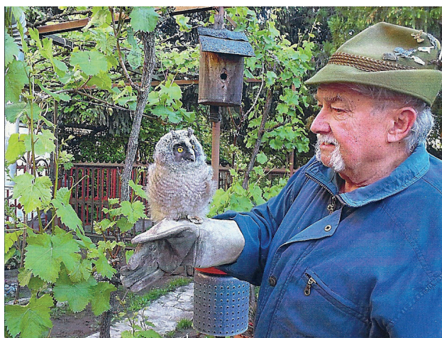
a „bagoly barát”