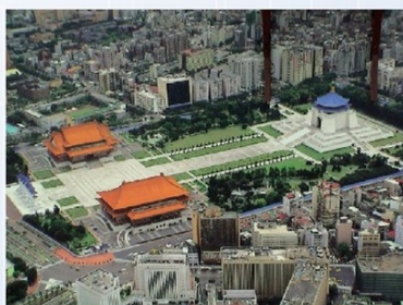
Tájkép a Taipei 101 felhőkarcolóból (Taiwan)

A Vég utcai ingatlanba költözés után, a jóval nagyobb hely, lehetőséget adott a géppark bővítésére. Saját felhasználási tapasztalat híján, a gépgyártók meglátogatása mutatkozott a legjobb megoldásnak.