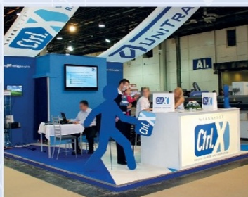
Első önálló kiállítási stand | MACH-TECH (2007)

Ekkor már sejthető volt, hogy ez is egy olyan állomás, amely a társaság jövőjét hosszú távon meghatározza. Később ez adta az ötletet szlogenükhöz is: „Egy mikron nem apróság.”