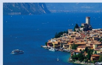
A milánói EMO-ról hazafelé | Garda tó (2009; a kép forrása: internet)

Ennek a nagy háztartási gépgyártó vevő első számú tengely beszállítójává vált később a társaság, maximálisan kiszolgálva az igényeiket.