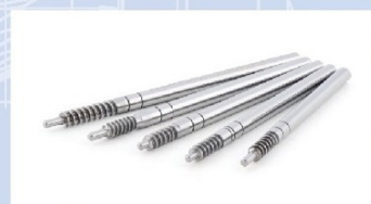
Ágyemelők villanymotor tengelyei

Egyik kecskeméti megrendelőjük akkortájt nagy mennyiségben vásárolt villanymotor-tengelyeket kórházi ágyak- és bútorigari megoldások emelő szerkezeteibe. Emiatt kézenfekvőnek látszott, hogy a cég előtt is lebegő elképzelésekhez fejlesszenek. Az említett gépeket már ezen magasabb hozzáadott értékű termékek gyártásához szerezték be.