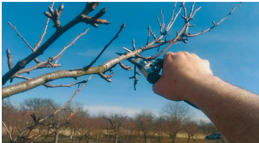
Almafa, metszés közben

A metszés műveletének időzítése kiemelkedő fontosságú. Általánosságban elmondható, hogy az éjszakai fagyoktól is mentes időszakot, napot, napokat jelöljük ki a gyümölcstermők koronaalakítására. A fagy – az általunk okozott sebek által – kárt okozhat az egészséges növényeinken is. Az almatermésűek és a szőlő metszését egész korán – ha az időjárás alkalmas – akár február elején is megkezdhetjük. A csonthéjas gyümölcsűeknél azonban érdemes megvárni a rügpattanás állapotát, ami általában csak március hónapban történik meg. Az időbeli differencia oka főleg a csonthéjasokra jellemző bakteriális kórokozók életmódjából ered. Ezek főleg a téli, hidegebb időszakokban képesek fertőzni, a friss sebek pedig kiváló lehetőséget nyújtanak a terjedésüknek.