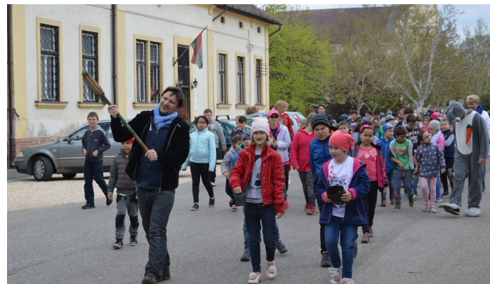
Húsvét a múzeumban cikkünk a 10. oldalon