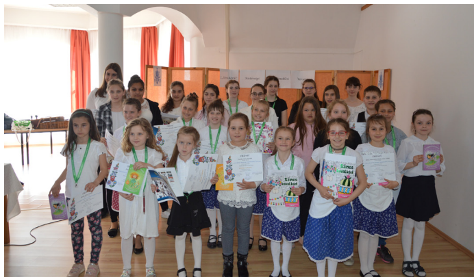
Népdaléneklési verseny beszámoló a 10. oldalon