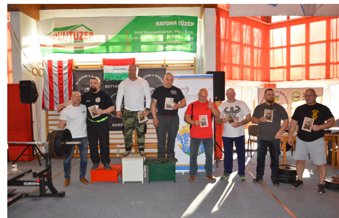
III. Alföldi Betyár Fekvenyomó Verseny részletek a 12. oldalon