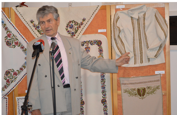
A Csengedi Hímzőkör kiállítása tudósítás a 8. oldalon