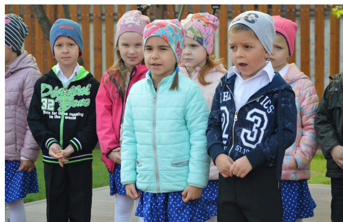
A bölcsőde és az óvoda felújított épületének ünnepélyes átadása - részletek az 5. oldalon