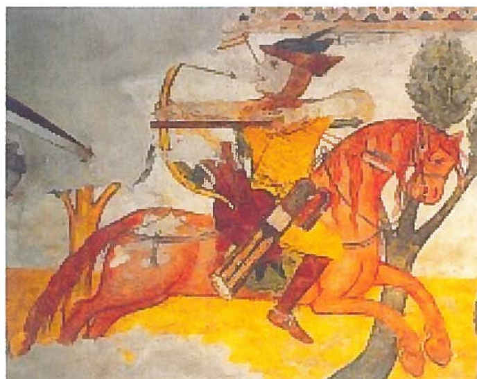
Jellegzetes kun vitéz