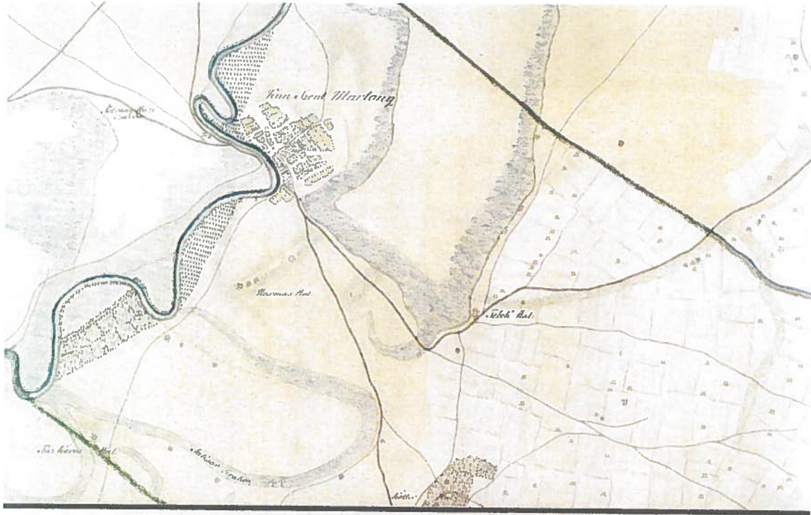
A Kötön-halom az I. katonai felmérés szelvényén, 1784