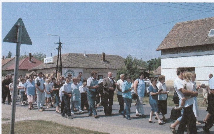
Kármel búcsú 2004.