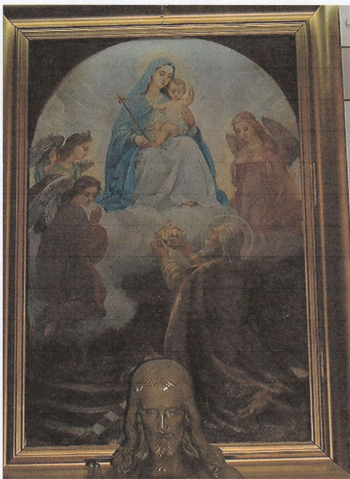
Karmel, főoltárkép: Magyarok Nagyasszonya