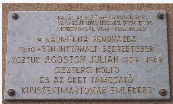
Karmel, a deportálás emléktáblája