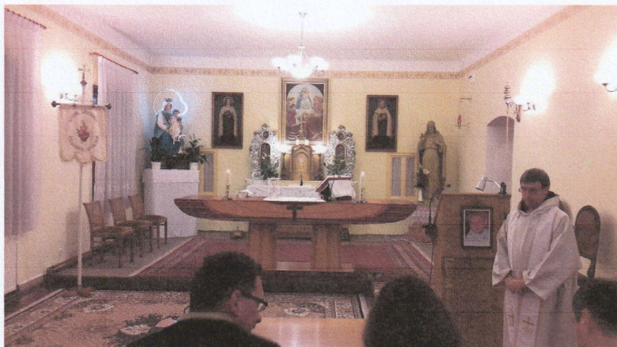
Karmel kápolna