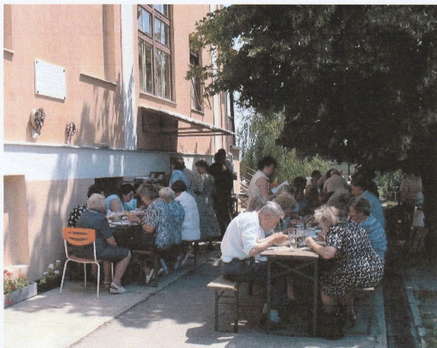
Karmel búcsú 2004. szeretetvendégség