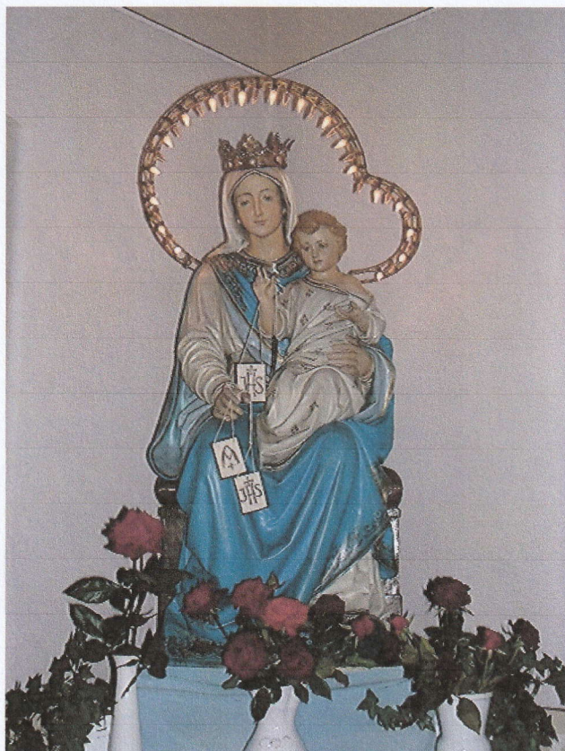
Kármel, Skapulárés Szűzanya szobra