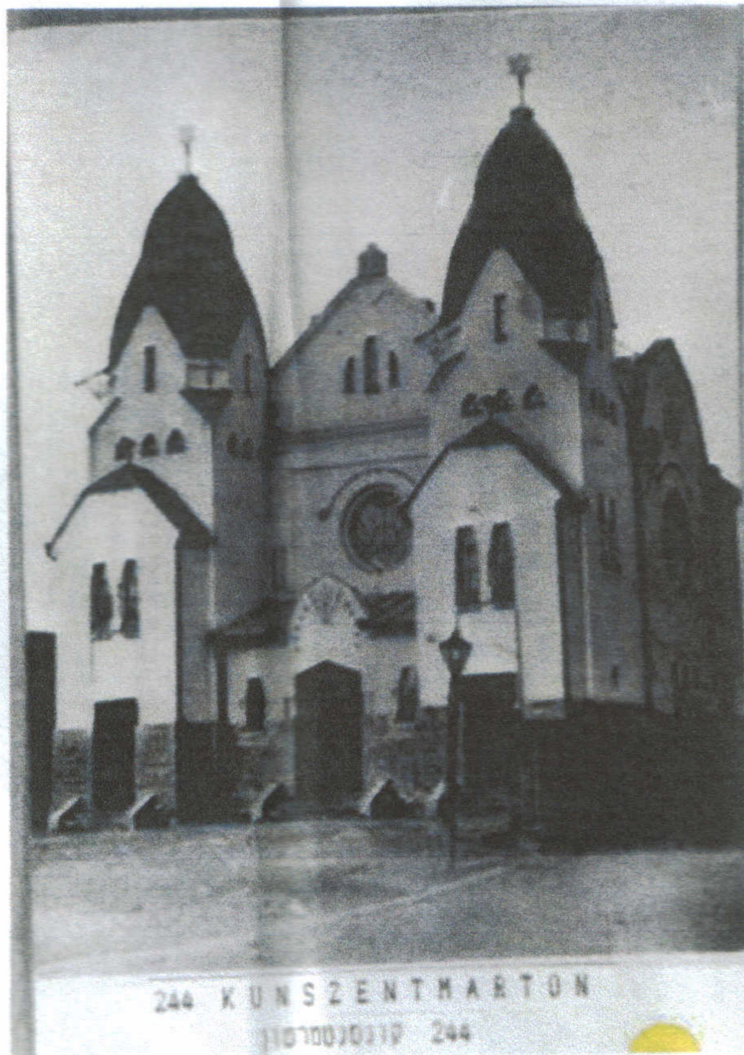
244 KUNSZENTMARTON 11070070119 244