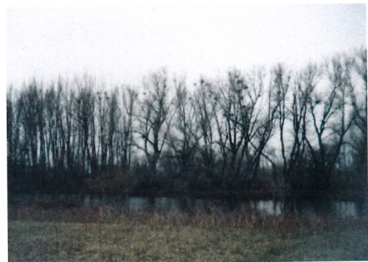
4.: Özényzugi holtág, telepesen fészkelő szürkegémek- kárókatonák.