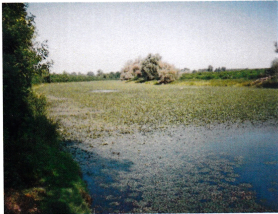
1.: Sulymosi holtág, sulyommal benőtt.