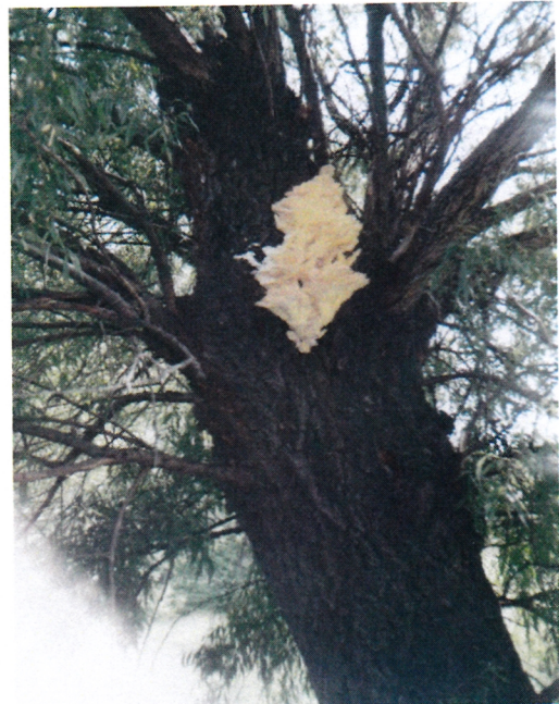
2.: Sulymosi holtág parti fáján sárgagévagomba 100 x 70 cm.