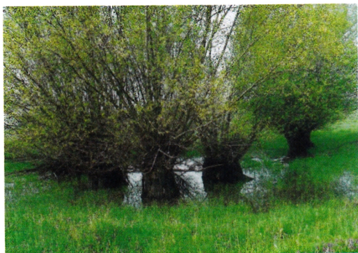
3.: Verebesi holtág öreg fűzfái.