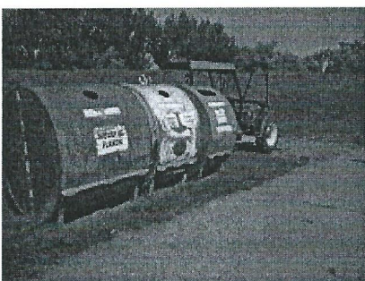
szelektív hulladékgyűjtő takarítás 002.jpg 3609K