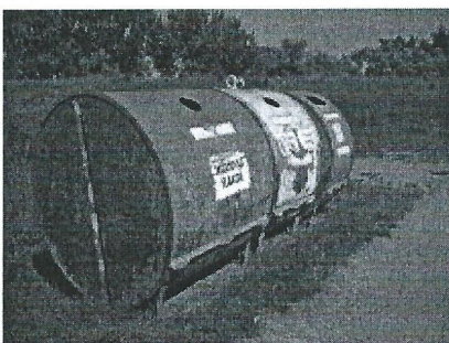
szelektív hulladékgyűjtő takarítás 001.jpg 3820K