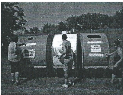
szelektív hulladékgyűjtő takarítás 003.jpg 3561K