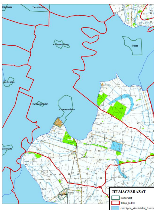
Az országos vízvédelmi terület övezete érinti Kunszentmárton közigazgatási területét

Az érintett belvízvédelmi művek esetében a KÖTIVIZIG rövid-és középtávú fejlesztést nem irányzott elő. Az M44 gyorsforgalmi út építése kapcsán a nyomvonallal érintett csatornákon kisebb nyomvonal korrekciók, rekonstrukciók és műtárgyépítések valósulnak meg.