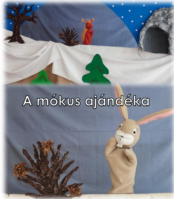
A mókus ajándéka