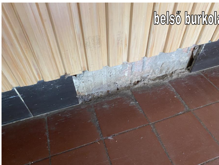
belső burkolatok, falak állapota