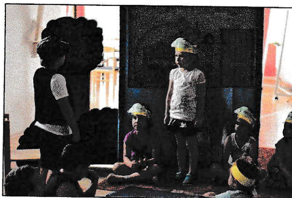
Körös –körül Könyvtári tábor