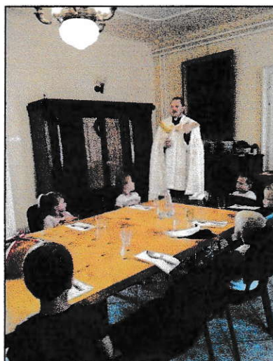
Drámatábor a Parókián